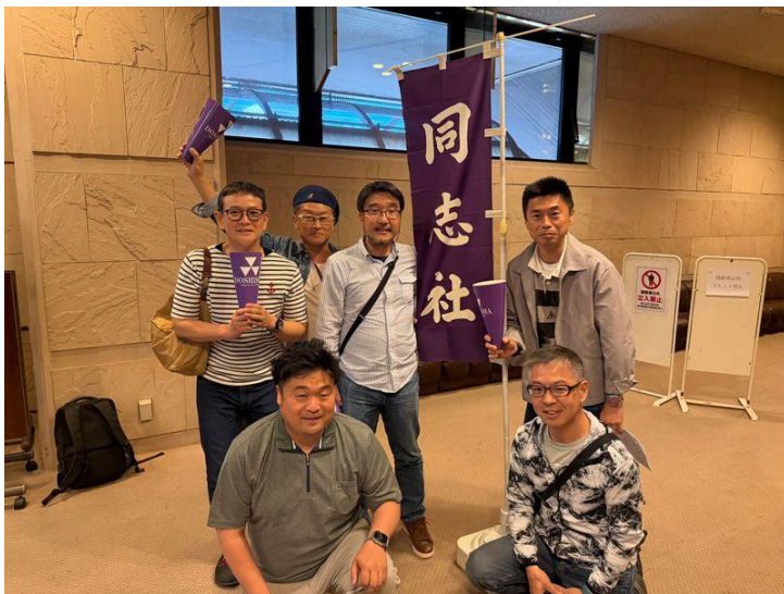
応援団を応援する6人組で会場(京都パルスプラザ)へ!