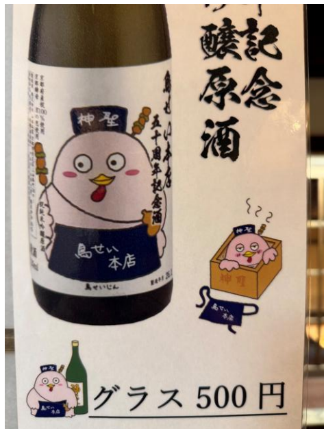
某有名ソシャゲのキャラクターに似ている…