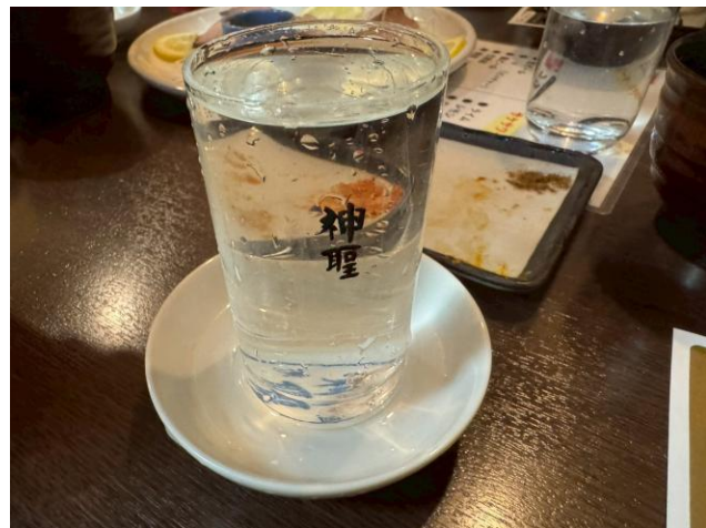
芳醇な原酒を楽しみました。ピッチャーで運ばれる日本酒は初体験(驚)